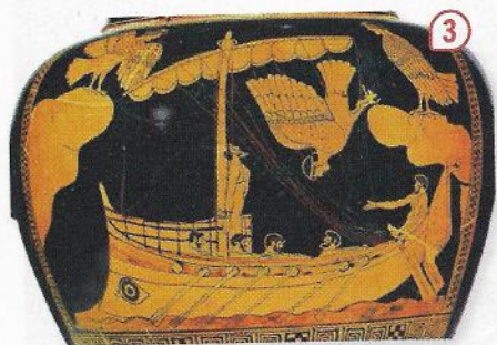
▲ Détail d'un vase, V e siècle avant J.-C. (British Museum, Londres).

Ulysse échoue sur l'île des Cyclopes (1), déjoue les ruses de la magicienne Circé (2) et doit affronter les Sirènes (3).