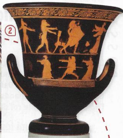
▲ Cratère, V e siècle avant J.-C. (MET, New-York).

Ulysse échoue sur l'île des Cyclopes (1), déjoue les ruses de la magicienne Circé (2) et doit affronter les Sirènes (3).